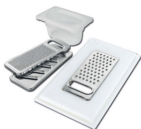
Kit grattugia con supporto per anello e vassoio di raccolta alimenti