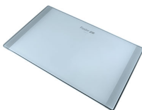
Tagliere in cristallo

* solo in abbinamento con l'accessorio 8644 101