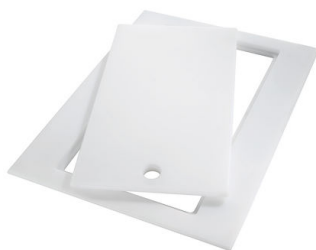
Tagliere Twin in HDPE