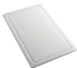
Tagliere in HDPE