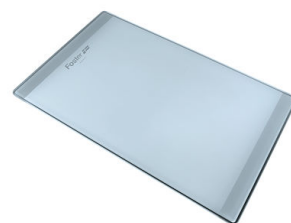
Tagliere in cristallo